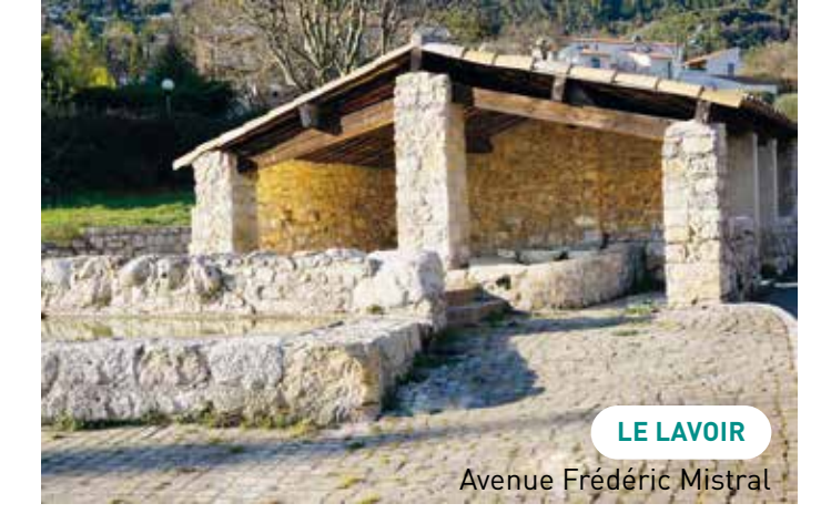
LE LAVOIR Avenue Frédéric Mistral

La commune de Peymeinade existe officiellement depuis le 19 juin 1868. Avant cette date, l'histoire de Peymeinade se confond avec l'histoire de la seigneurie de Cabris puis après la Révolution, avec celle de la commune de Cabris.