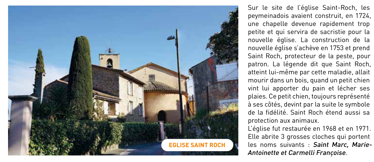
EGLISE SAINT ROCH

Sur le site de l'église Saint-Roch, les peymeinadois avaient construit, en 1724, une chapelle devenue rapidement trop petite et qui servira de sacristie pour la nouvelle église. La construction de la nouvelle église s'achève en 1753 et prend Saint Roch, protecteur de la peste, pour patron. La légende dit que Saint Roch, atteint lui-même par cette maladie, allait mourir dans un bois, quand un petit chien vint lui apporter du pain et lécher ses plaies. Ce petit chien, toujours représenté à ses côtés, devint par la suite le symbole de la fidélité. Saint Roch étend aussi sa protection aux animaux. L'église fut restaurée en 1968 et en 1971. Elle abrite 3 grosses cloches qui portent les noms suivants : Saint Marc, Marie-Antoinette et Carmelli Française .