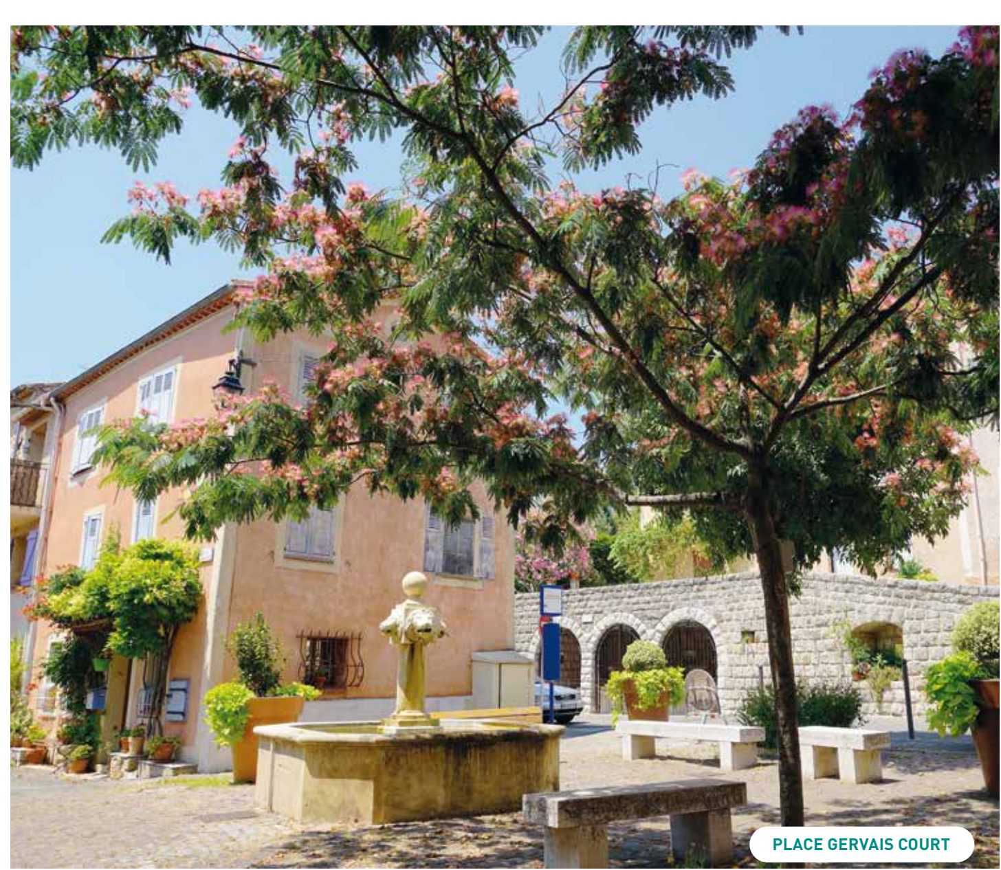
PLACE GERVAIS COURT