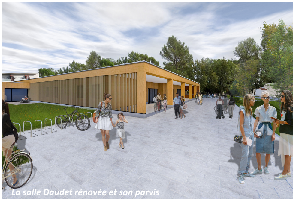
La salle Daudet rénovée et son parvis

- l'aménagement d'une salle de spectacle moderne et confortable, d'une capacité de 270 places, au sein de la salle Daudet dont une majeure partie du bâti sera conservé. L'équipement comprendra une scène de plain-pied et des gradins rétractables pour permettre de moduler l'espace en fonction des besoins et des publics. Le bâtiment rénové et agrandi sera agrémenté d'une banque d'accueil, d'une salle de réception et d'un parvis ;