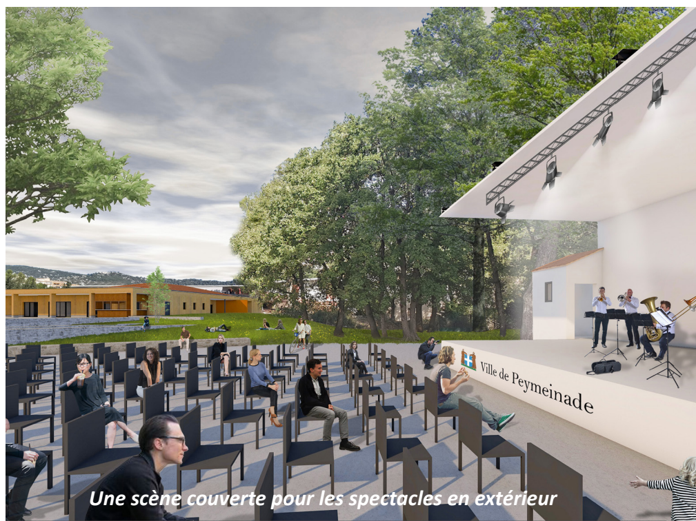
Une scène couverte pour les spectacles en extérieur

La future salle de spectacle sera exemplaire en matière de protection de l'environnement et de développement durable, ce qui permet à la commune de se porter dès à présent candidate au label « Bâtiment Durable Méditerranéen ».