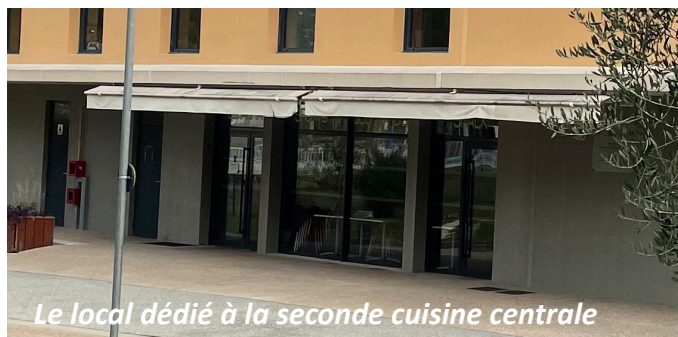
Le local dédié à la seconde cuisine centrale